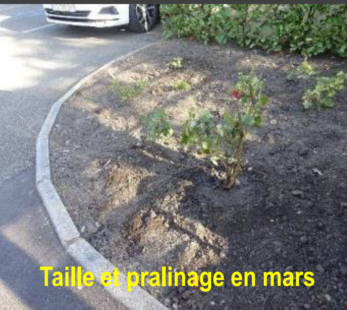
Taille et pralinage en mars

Devant cette situation inadmissible de la part d'une entreprise de jardiniers professionnels ..., je décidai de me charger du "sauvetage" de ce rosier.