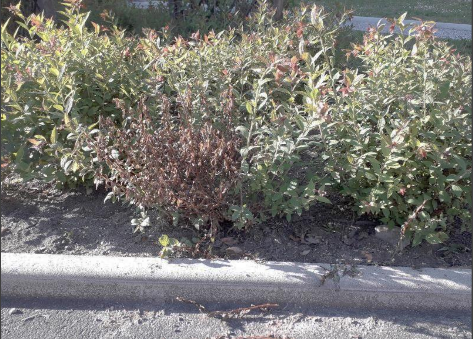
Massif en bord allée centrale devant Bâtiments C et D : Pied de spirée sec à remplacer