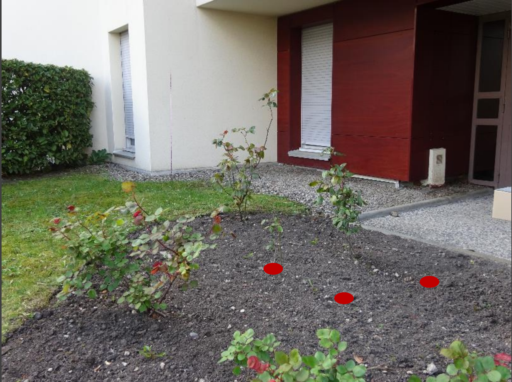
Massif de rosiers à l'entrée du Bâtiment E : plusieurs pieds sont manquants