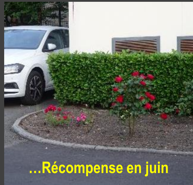
...Récompense en juin